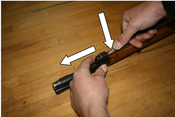
3. Den Bajonetthalter durch Niederdrücken der Arretierung an der Unterseite lösen und nach vorne abziehen