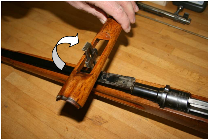
7. Handschutz um 90 Grad drehen und über das Visier abnehmen