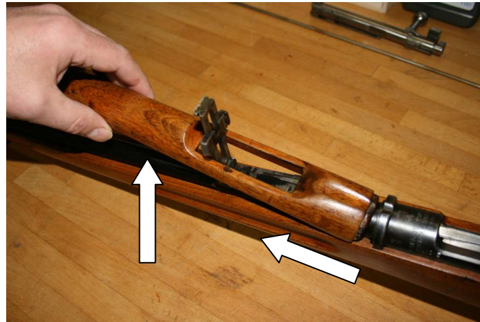
6. Oberen Handschutz anheben