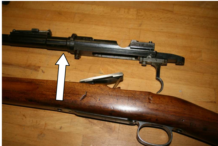
9. Lauf mit Patronenlager und Abzugseinheit vom Schaft trennen