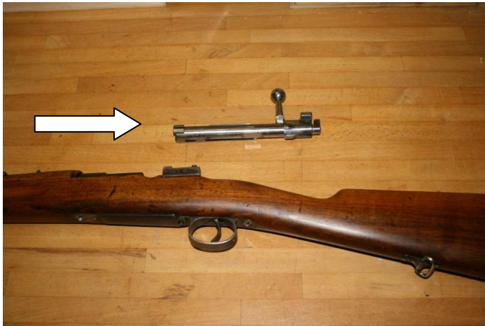
1. Verschluss entfernen