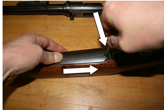
10. Magazinkastendeckel durch Drücken der Arretierung entfernen