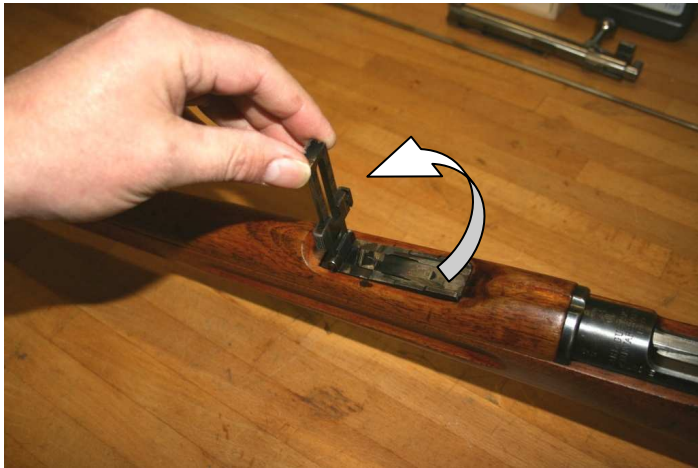
5. Visier senkrecht aufklappen